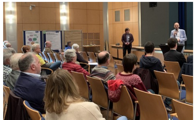
Andreas Buske eröffnet die Öffentlichkeitsveranstaltung.

Wie kann die Mobilität in Weinheim zukunftsfähig organisiert werden? Wie können sich unterschiedliche Verkehrsmittel ergänzen? Und was macht ein lebenswertes, nachhaltiges und klimagerechtes Weinheim für Alle mit Blick auf die Mobilität aus? Unter anderem mit diesen Fragen eröffnete Andreas Buske, Erster Bürgermeister der Stadt Weinheim , den Abend und begrüßte die Anwesenden, denen er für ihr bislang gezeigtes Engagement dankte. Gleichzeitig rief er sie auf, am Ball zu bleiben und sich auch weiterhin einzubringen. Herr Buske betonte die große Bedeutung der nun vorliegenden Analyseergebnisse und hob die Chancen hervor, die darin liegen, aus den Erkenntnissen die richtigen Schlussfolgerungen zu ziehen und in den nachhaltigen Mobilitätsplan Weinheim 2040 einfließen zu lassen.