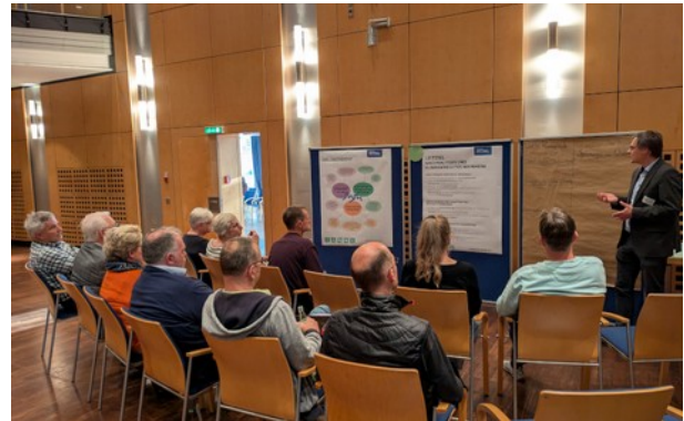
Ergänzung und Konkretisierung von Zielen an Station 2.

Das zentrale Thema an Station zwei zum Leitziel Nachhaltiges und klimagerechtes Weinheim war die Stärkung des ÖPNV . Die Teilnehmenden sahen darin eine Voraussetzung für die Reduzierung des Autoverkehrs und das Erreichen von Klimaneutralität. Dabei betonten sie, dass ein zuverlässiger, planbarer und bei Ausfällen abgesicherter ÖPNV unerlässlich sei. Neben guten Umsteigebeziehungen wünschten sich die Anwesenden auch attraktiv gestaltete Umsteigepunkte. Eine möglichst kostengünstige Nutzung sollte mit transparenter Tarifgestaltung und einfacher Handhabung einhergehen. Mit Blick auf die Erschließungsqualität stand weniger die Ausweitung des Angebots im Fokus, sondern vielmehr die Verbesserung der Pünktlichkeit. Die Gruppen hoben hervor, dass neue Lösungen nicht zwangsläufig in einem Mehr an Fahrten liegen müssten, sondern vielmehr in kreativen Ansätzen – etwa in Randzeiten. Hier wurden insbesondere der Ausbau von On-Demand-Angeboten sowie die bessere Erreichbarkeit von Ruf-Taxen genannt. Auch der Einsatz von Bussen sollte noch stärker bedarfsorientiert geplant werden, um effizientere Anbindungen an umliegende Quartiere und Ortsteile zu ermöglichen. Zusätzlich sahen die Anwesenden großes Potential in intelligenten (digitalen) Lösungen zur besseren Vernetzung: gemeinsame Fahrten per App, Mitfahrbänke und der Ausbau von Car-Sharing-Angeboten – insbesondere in den Ortsteilen – wurden als Ziele ergänzt.